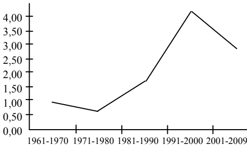
Рис. 2. Сукупна факторна продуктивність сільського господарства Китаю (середньорічні темпи приросту) [19, с. 20]

належать до категорії земель із низкою врожайністю. Спустелювання, ерозія землі, дефіцит водних ресурсів, підвищення кислотності і лужності ґрунтів призвели до виснаження 40% усієї придатної для сільського господарства землі, причому, за різними оцінками, близько 20% земель у різних ступенях забруднені шкідливими речовинами [18, с. 7].