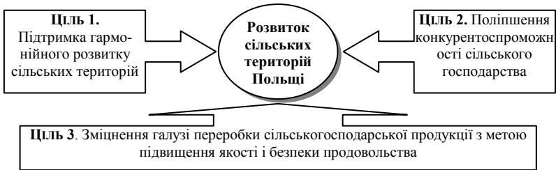
Рис. 3. Цілі, досягнення яких забезпечує розвиток сільських територій (авторська розробка на підставі: [31])

бізнесу на сільських територіях, у тому числі, не пов'язаному із сільським господарством, було видано 19 тис. грантів та кредитів, якими скористались 75 тис. представників бізнесу, що дало змогу створити або зберегти 37700 робочих місць у сільській місцевості. Для реалізації зазначеного було виділено майже 7 млрд дол. з різних джерел фінансування, у тому числі 1,4 млрд дол. державних коштів. У рамках проектів інвестування у людський розвиток було здійснено поліпшення 8000 об'єктів соціально-культурно-побутового призначення, які були у критичному стані, серед них 947 закладів освіти, 481 бібліотека, 1082 установи охорони здоров'я, 3444 об'єкти громадської безпеки, загальна кількість жителів села, які мають до них доступ становить близько 30 млн осіб. Окрім того, 627000 сільських родин та понад 21000 обшин отримали допомогу для купівлі, ремонту або рефінансування житла, було фінансоване будівництво 1000 багатоквартирних житлових комплексів у сільській місцевості [33].