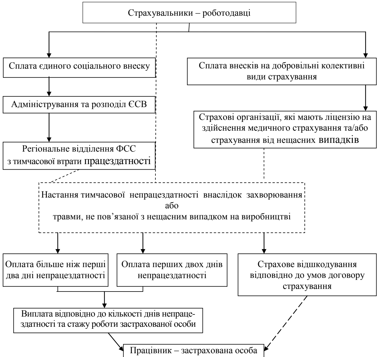
Рис. 2. Організаційна схема фінансування системи соціального страхування з тимчасової втрати працездатності за умов використання обов'язкової і добровільної форм страхування

Висновки. Отже, удосконалення системи соціального страхування з тимчасової втрати працездатності повинно відбуватися на чотирьох рівнях: