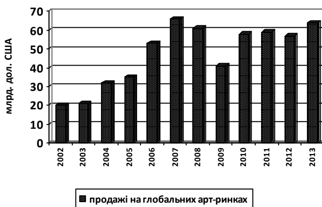
Рис.1 Динаміка і обсяги продаж на глобальному арт-ринку

Аналіз географії розподілу продаж на світовому арт-ринку у 2013 році (рис.2) показує, що перше місце