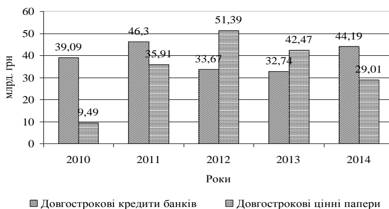
Рис. 2. Залучення інвестицій в економіку України через інструменти фондового ринку 2010–2014 рр., млрд. грн*

*Макроекономічні показники за 2014 рік і окремі дані за 2013 рік надано без урахування тимчасово окупованої території АР Крим і м. Севастополя.