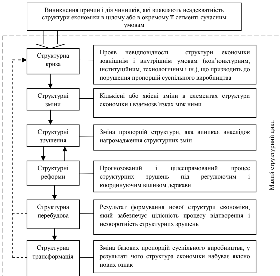
Рис. 1. Етапи циклу структурного розвитку економіки*

Про невідворотність структурних трансформацій в українській економіці на даному етапі свідчать наступні кон'юнктурні чинники.