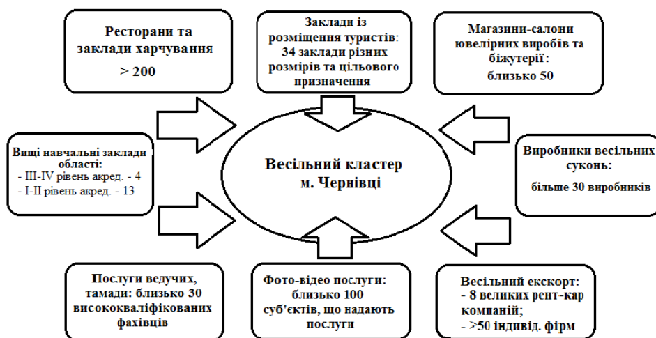
Рис. 1. Основні суб'єкти, що потенційно можуть утворити весільний кластер

Окрім передумов, вказаних у табл. 1, варто враховувати велику кількість потенційних членів кластеру, а саме суб'єктів, що функціонують у галузі весільного бізнесу (рис. 1).