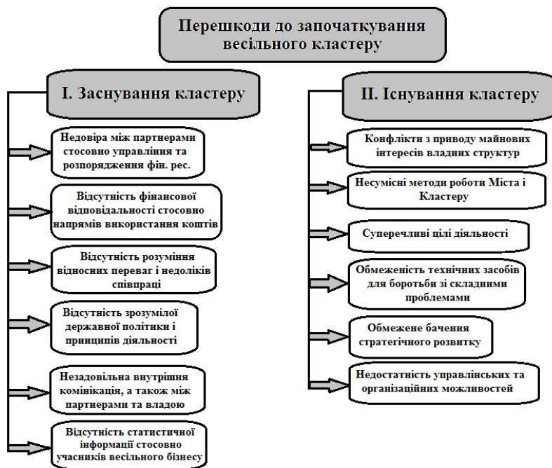
Рис. 2. Перешкоди до започаткування весільного кластеру в м. Чернівцях на етапах заснування та існування кластеру

Обмеженість ресурсів (як людських, так і фінансових) для боротьби зі складними проблемами. Природно, що окремі представники бізнесу зіштовхуються з проблемою обмеженості ресурсів у випадку необхідності протистояти певним викликам, однак об'єднання їх у кластер надає всі необхідні ресурси для боротьби з ними (наприклад, при раптовому підвищенні цін на матеріальні ресурси, необхідні для виробництва готової продукції, об'єднані у кластер бізнесмени можуть просити про суттєву знижку або ж про поступове підвищення цін, що компенсується для постачальника ресурсів масштабністю замовлення).