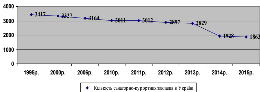
Рис.1. Динаміка зміни кількості санаторно – курортних закладів в Україні за 1995-2015рр. [5, с.238]

Результати дослідження доводять значне скорочення кількості санаторно-курортних закладів в Україні протягом 1995-2015рр. (рис.1). Так, якщо у 1995 році їх кількість становила 3147 одиниць, то у 2015 році скоротилась до 1863 одиниці.