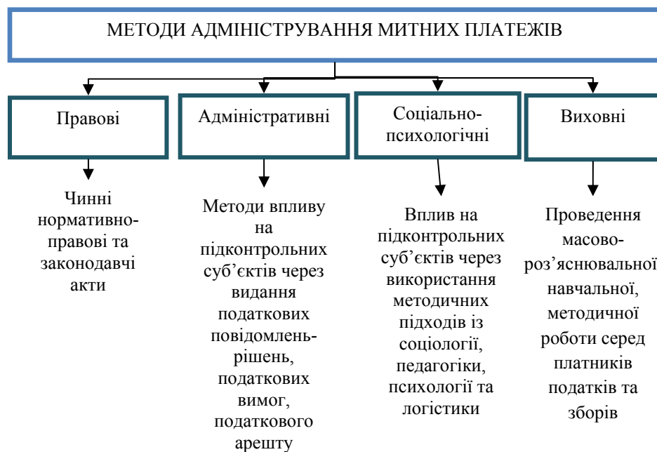
Рис. 2. Методи адміністрування митних платежів Джерело: на основі [3].

7. Нікіпчук О.О., Лопатовський В.Г. Особливості адміністрування митних платежів в Україні / Нікіпчук О.О., Лопатовський В.Г. // Проект SWorld міжнародная научно-практическая Інтернет-конференція «Modern directions of theoretical and applied researches'2013» . - 19-30 марта 2013. - Режим доступу: http://www.sworld.com.ua/konfer30/186.pdf .