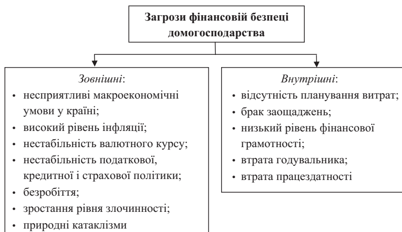
Рис. 2. Класифікація загроз фінансовій безпеці домогосподарства

сприятливими змінами демографічної ситуації, як скорочення загальної чисельності населення, зниження народжуваності, високий рівень передчасної смертності, унаслідок чого не забезпечується просте відтворення населення [10, с. 111].