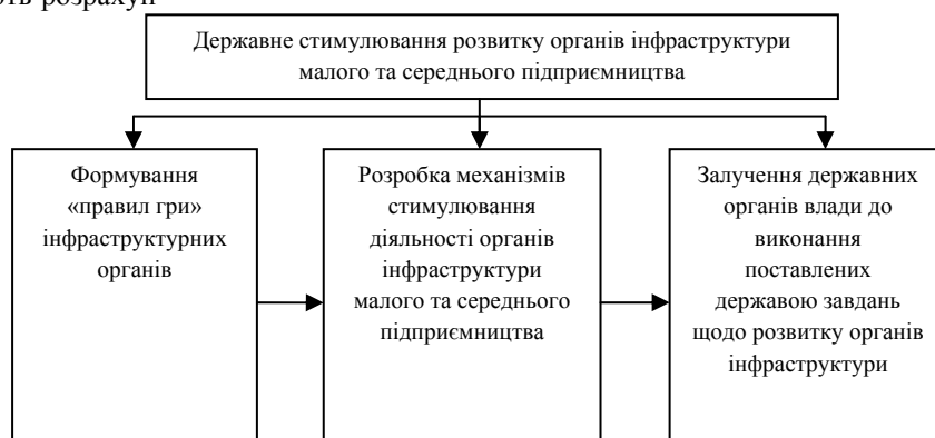
Рис. 2. Загальна схема державного стимулювання функціонування органів інфраструктури малого та середнього підприємництва*

Для того, щоб органи інфраструктури у сфері малого та середнього підприємництва повноцінно функціонували, потрібно спочатку окреслити так звані «правила гри», тобто теоретично обґрунтувати, яким чином повинні функціонувати ті чи інші інфраструктурні інституції, що відноситься до сфери законодавчо-нормативних вказівок та наукових рекомендацій. Розробивши теоретичні рекомендації, потрібно їх реалізовувати, впроваджуючи механізми функціонування інфраструктурних органів на практиці, що передбачає виконання державними органами влади виконання поставлених державою завдань щодо розвитку інфраструктурних інституцій.