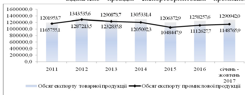
Рис. 2. Обсяги експорту товарної продукції та експорту промислової продукції у Львівській області, тис. дол. США

Щодо практики розвитку експортних операцій, то Департаментом економічної політики Львівської обласної державної адміністрації було розроблено каталог під назвою «Експортний потенціал Львівщини», у якому відзначено провідні експортоорієнтовані промислові