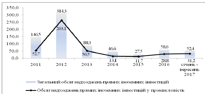
Рис. 3. Надходження прямих іноземних інвестицій в економіку Львівської області, млн. дол. США

обсяг надходжень прямих іноземних інвестицій у промисловість знизився на 95,6%, порівняно із 2012 роком, коли значення обсягу надходжень було найвищим (263,1 млн. дол. США) (рис. 3). Водночас у 2016 спостерігалось зростання цього показника у 2,5 рази у порівнянні із 2015 роком, а протягом періоду січня-вересня 2017 року, порівняно із аналогічним періодом попереднього року – у 2,2 рази [4].