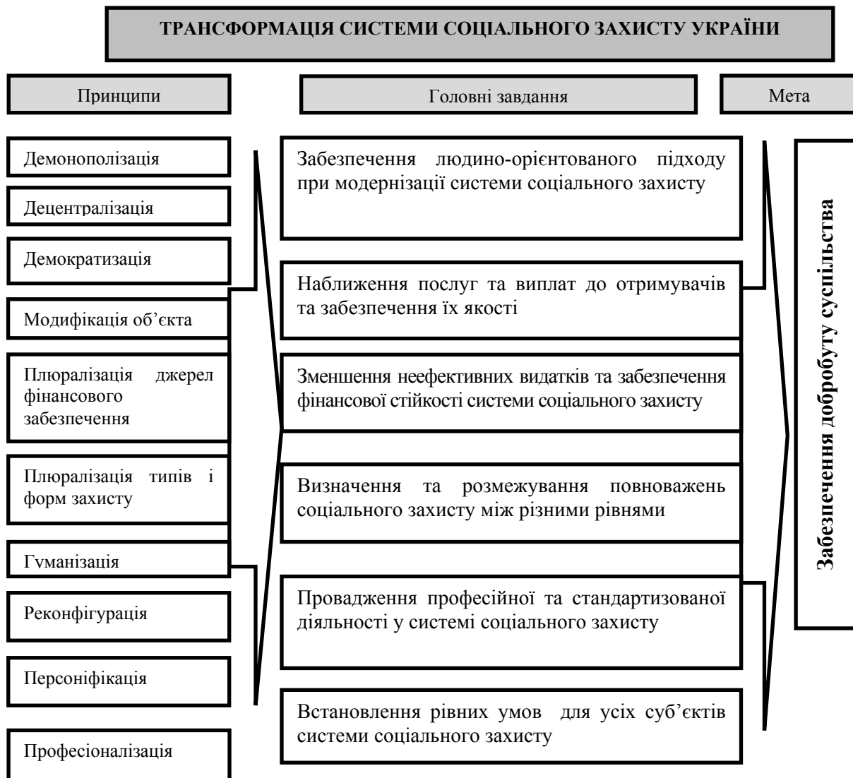
Рис.1. Принципи, головні завдання та мета трансформації системи соціального захисту України * Побудовано автором з урахуванням [10]

повноцінно функціонуючої, ефективною, фінансово стабільної системи соціального захисту, потребує визначення принципів, головних завдань (перелік усіх завдань є набагато більшим) та мету процесу трансформації системи соціального захисту, що визначають бажаний кінцевий стан системи соціального захисту (рис. 1).