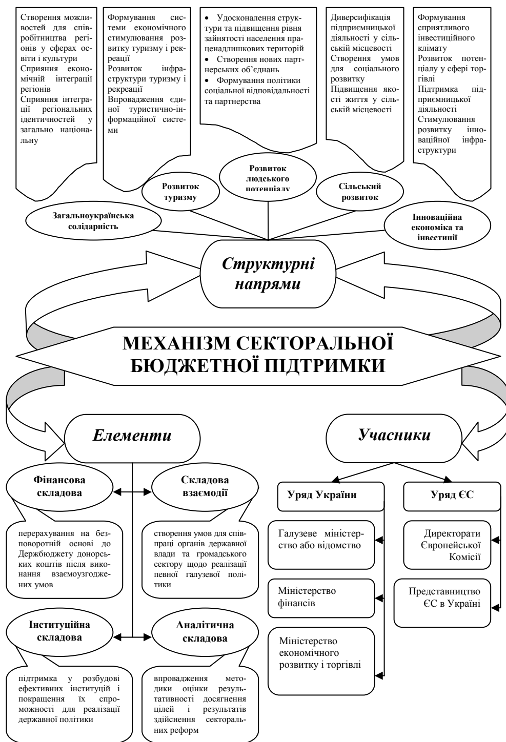
Рис. 1. Структура механізму секторальної бюджетної підтримки ЄС Україні Побудовано автором