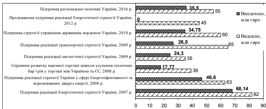
Рис. 4. Статистика секторальної бюджетної підтримки в Україні, 2007-2016 рр.