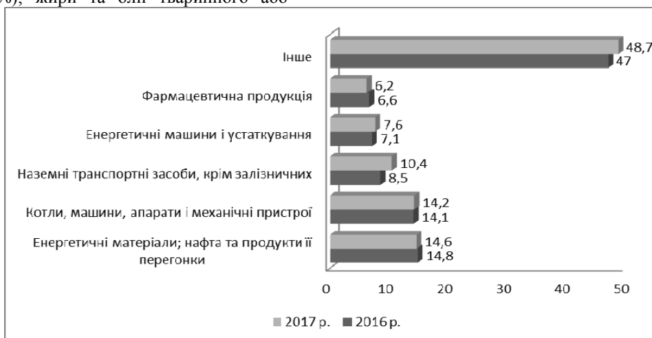
Рис. 2. Основні товарні групи українського імпорту в країни ЄС [1; 6]

Отже, у структурі основних товарних груп українського експорту у країни ЄС переважає сировинна та сільськогосподарська спеціалізація. Подібну тенденцію необхідно змінити, збільшивши у структурі експорту частку електричних машин, устаткування і програмного забезпечення [2; 3].