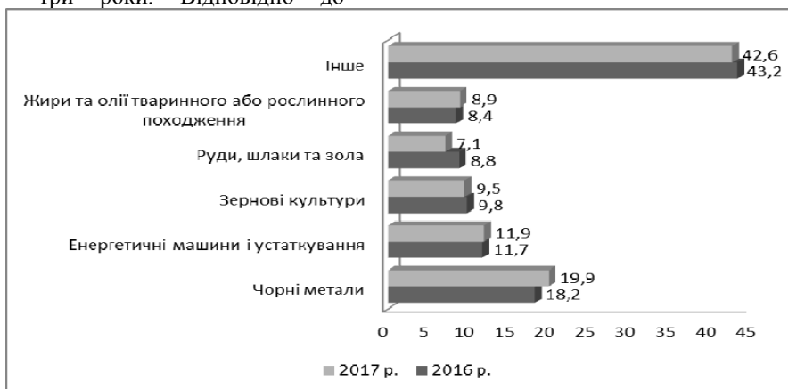
Рис. 1 Основні товарні групи українського експорту в країни ЄС [1; 6]

формули, зазначеної вище, ставка ввізного мита у 2016 р. становила 7,5%, у 2017 р. – 5%, у 2018 р. – 2,5% ( 10 - 10/4 \times 3 = 2,5\% ) і буде повністю лібералізована у 2019 р.