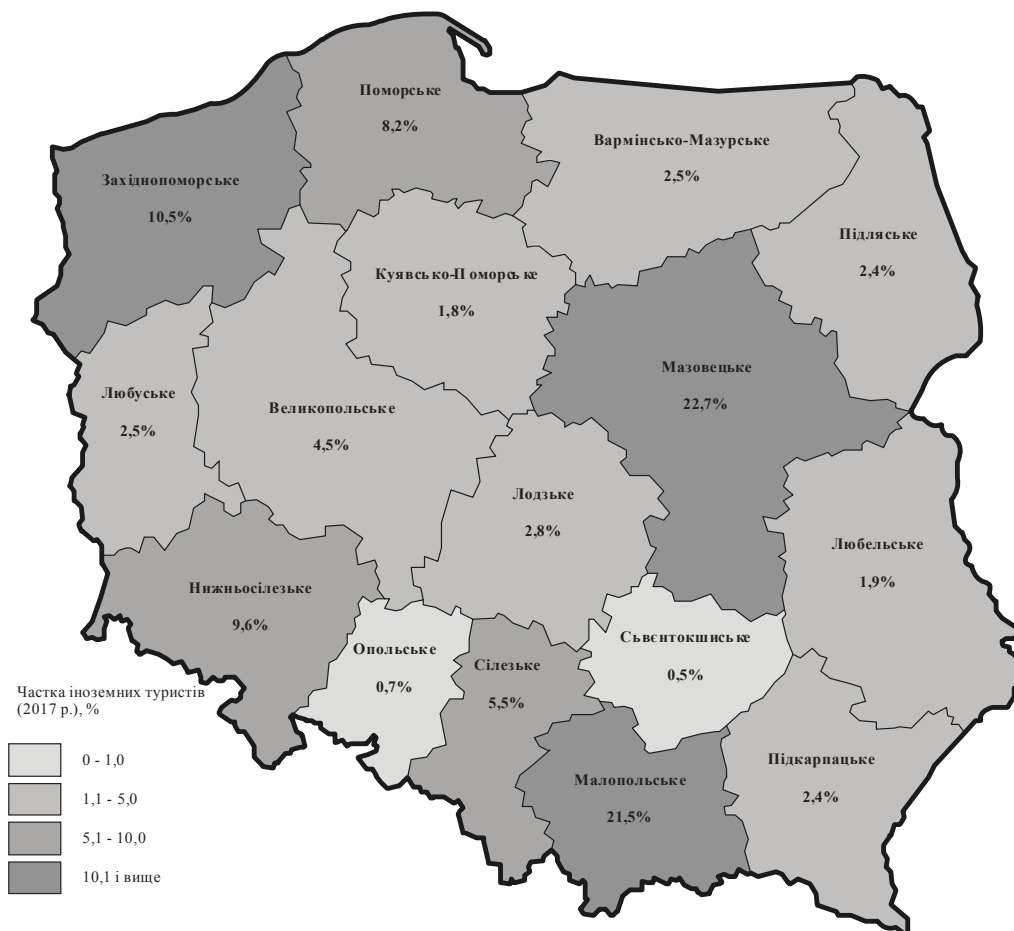
Рис. 2. Частка іноземних туристів у регіонах Польщі (2017 р.)