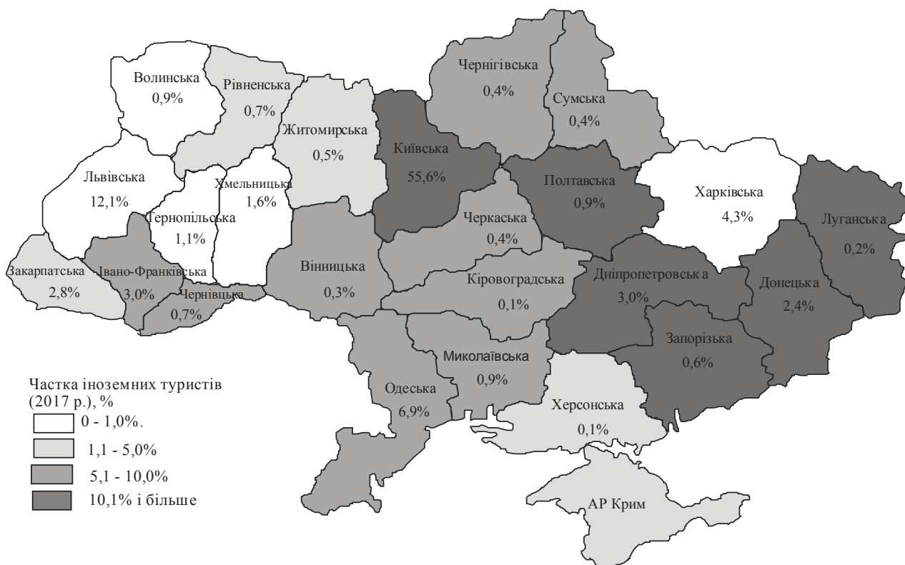
Рис. 1. Частка іноземних туристів у регіонах України (2017 р.)