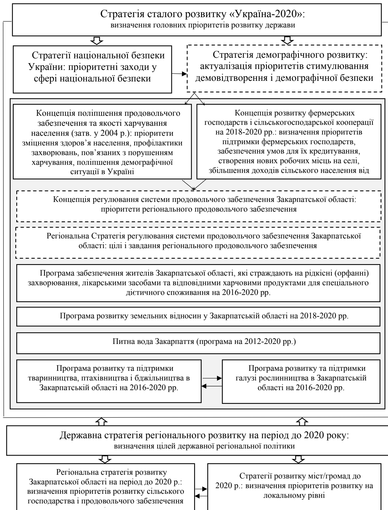
Рис. 1. Місце Концепції регулювання системи продовольчого забезпечення Закарпатської області у нормативно-правовій основі України стратегічного характеру (блоки із суцільною лінією – чинні нормативи; з пунктирною лінією – актуальні для затвердження нормативи)

досягненню цілей загальнонаціональних концепцій за цим напрямом (рис. 2).