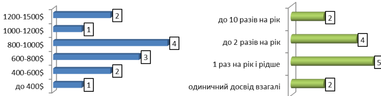
Рис. 2. Розподіл українських трудових мігрантів за розміром середньомісячної заробітної плати в окремих країнах Європи та частотою виїздів за кордон (осіб)

Побудовано на основі експертного опитування 13 українських громадян, країнами трудової міграції яких були Чехія, Іспанія, Італія та Литва.