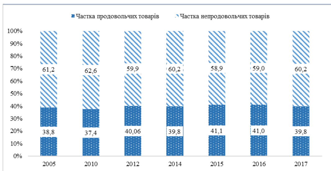
Рис. 2. Структура роздрібного товарообороту України, %