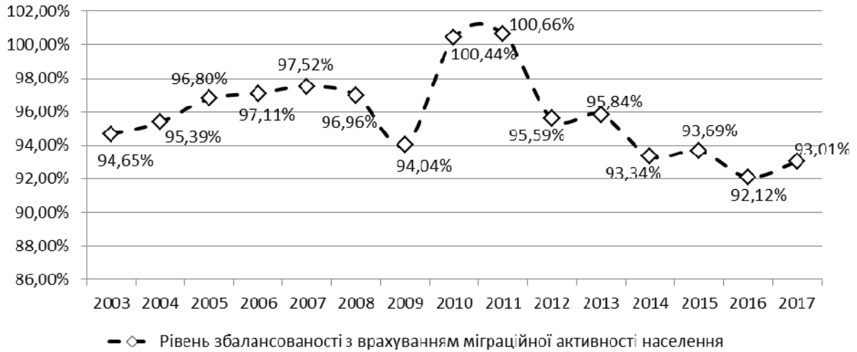
Рис. 2. Інтерпретація ситуації на ринку праці з врахуванням рівня міграційної активності за 2003-2017 рр. Побудовано автором.

на ринку праці не спостерігається. Для розуміння причин цієї ситуації необхідно здійснити факторний аналіз впливу на рівень збалансованості ринку праці, який враховує міграцію населення.