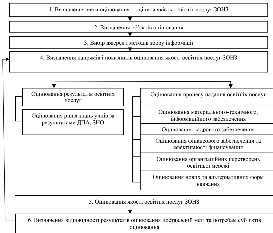
Рис. 1. Алгоритм оцінювання якості освітніх послуг загальної середньої освіти