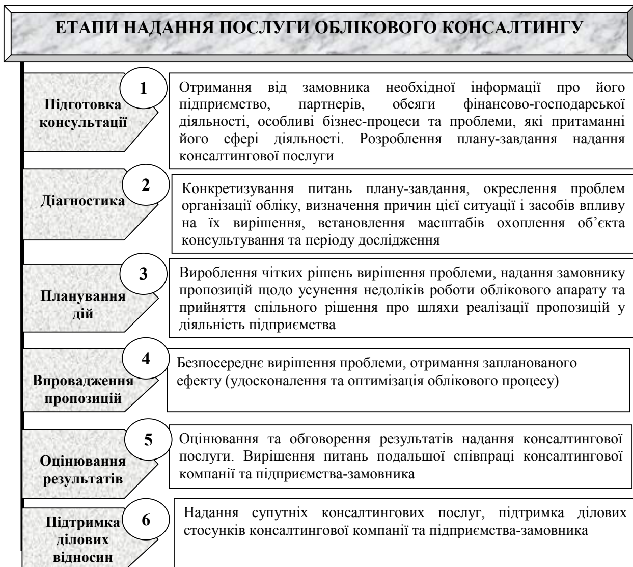
Рис. 5. Етапи надання послуги облікового консалтингу

За результатами дослідження процесу надання консалтингових послуг пропонуємо розглядати шість етапів надання послуги облікового консалтингу (рис. 5).