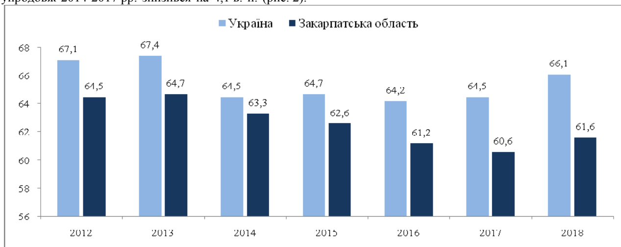
Рис. 2. Рівень зайнятості населення у віці 15-70 років, %

Загалом, значення цього показника у Закарпатській області, порівняно з показником по Україні, є невисоким, і цей розрив поглиблюється – у 2018 р. різниця склала 4,5 в. п., тоді як у 2014-му – 1,2 в. п. У підсумку, за рівнем зайнятості населення регіон стабільно займає 19-те місце, випереджаючи (у 2018 р.) Волинську, Чернівецьку, Донецьку, Тернопільську та Івано-Франківську області.