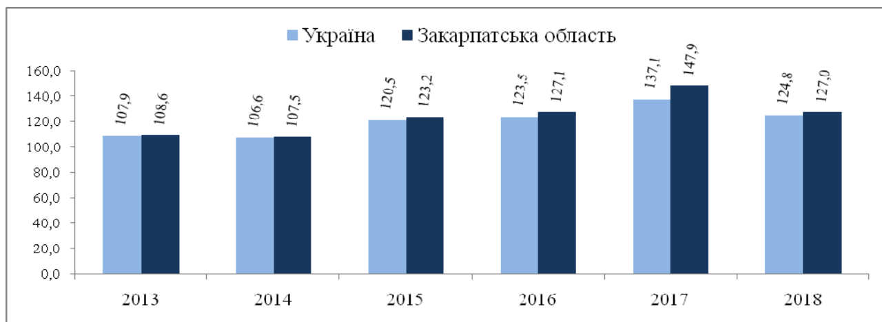
Рис. 4. Динаміка середньої заробітної плати, у % до попереднього року

Формування конкурентного середовища стимулює зростання середньої заробітної плати на ринку праці Закарпатської області, яке упродовж 2013-2018 рр. перевищувало середній рівень в Україні, зокрема у 2018 р. – на 2,2 в. п., а у 2017-му – на 10,8 в. п. (рис. 4).