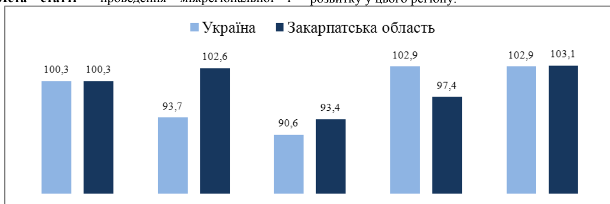
Рис. 1. Індекс фізичного обсягу ВВП у розрахунку на одну особу, %

Основні результати дослідження. Економіка Закарпатської області, порівняно з іншими регіонами, є невеликою – у 2016-2017 рр. ВВП області займав 1,4% ВВП України [6]. Для порівняння, частка ВВП Львівської області у ВВП України у 2017 р. становила 4,9%, Івано-Франківської – 2,1%, Волинської – 1,7%. Обсяг ВВП на одну особу у Закарпатській області у 2017 р. склав 34 202 млн грн, що у понад 2 рази менше, ніж у середньому в Україні. З-поміж 24-х регіонів за цим показником область займала 22-ге місце, випереджаючи у 2017 р. Луганську і Чернівецьку, а у 2013-му – Чернівецьку і Тернопільську області. Водночас індекс фізичного обсягу ВВП у розрахунку на одну особу в Закарпатській області упродовж 2014-2017 рр. (окрім 2016-го) перевищував середнє значення показника в Україні (рис. 1), що є ознакою наявності потенціалу розвитку у цього регіону.