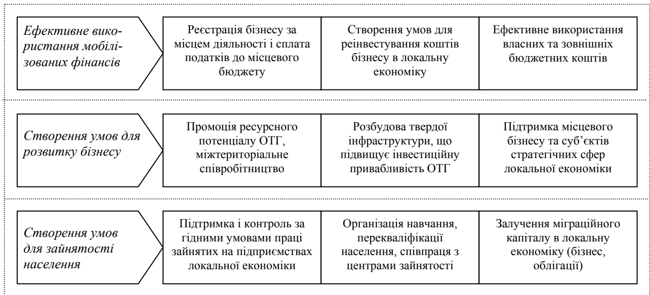
Рис. 2. Стратегічні цілі розвиткового характеру ОТГ в Україні