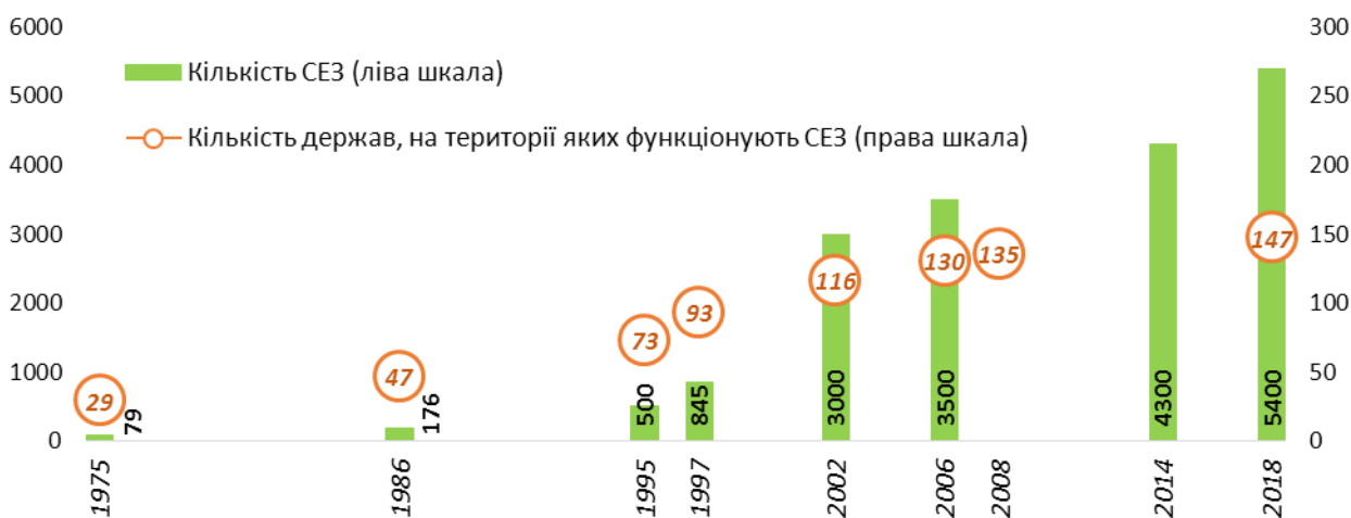
Рис. 1. Динаміка створення СЕЗ у країнах світу

Основні результати дослідження. «Бум» СЕЗ упродовж останніх десятиліть має дві головні передумови: з одного боку, створення СЕЗ є частиною нової хвилі промислової політики та відповіддю на посилення конкуренції за міжнародну мобільність інвестицій; з іншого – СЕЗ є одним з інструментів реалізації політики стимулювання місцевого економічного зростання, яка реалізується в країнах-членах ЄС з 2010 р. (рис. 1).