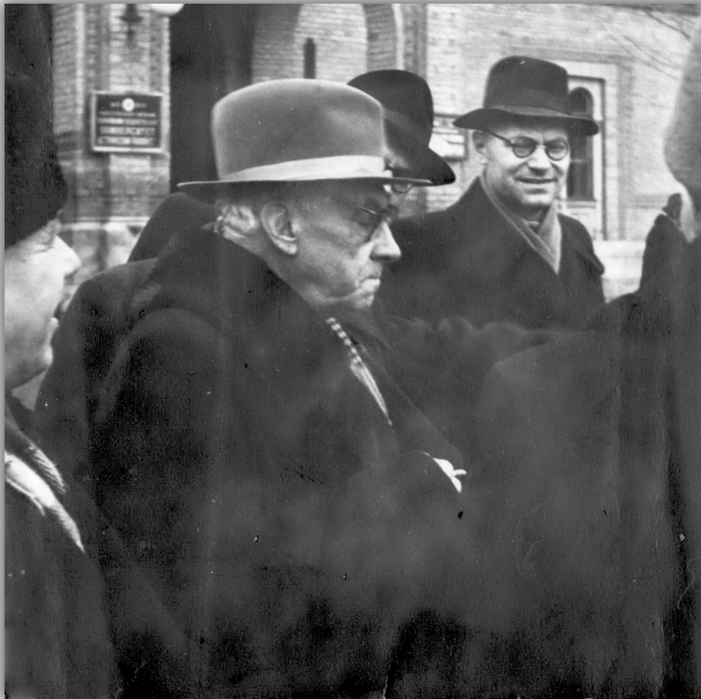
У Чернівецькому університеті з Максимом Рильським, 14 грудня 1957 р.

Народився Василь Лесин 8 (21) березня 1914 р. в селі Хотіївка, нині Корюківського району Чернігівської області, у сім'ї хліборобів. Рано втратив батька, тож у шістнадцятирічному віці змушений був стати на самостійний трудовий шлях, виїхавши з рідних місць на Північний Кавказ, до Абхазії. Один час наймитував у власника двох буйволів, який мав гучний титул князя. На підприємствах і в установах міста Сухумі працював різноробом, культармієм, секретарем-діловодом, викладачем лікнепу. А голодоморного 1933 р., маючи за плечима семирічну освіту, вступив до Івановського технікуму громадського харчування. Навчаючись там на "відмінно", одночасно вчителював.