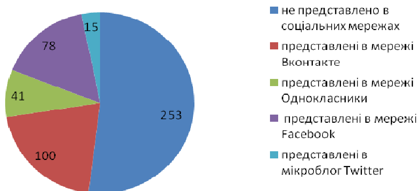
Мал. 2 Числовий показник інтеграції українських музеїв в соціальні мережі

Проаналізувавши дані із діаграм можна зробити висновок, що діяльність у соціальних мережах не є пріоритетною для українських музеїв. Робота в соціальних мережах є незапланованою та нестабільною, погано налагоджені зв'язки між музеєм та підписниками.