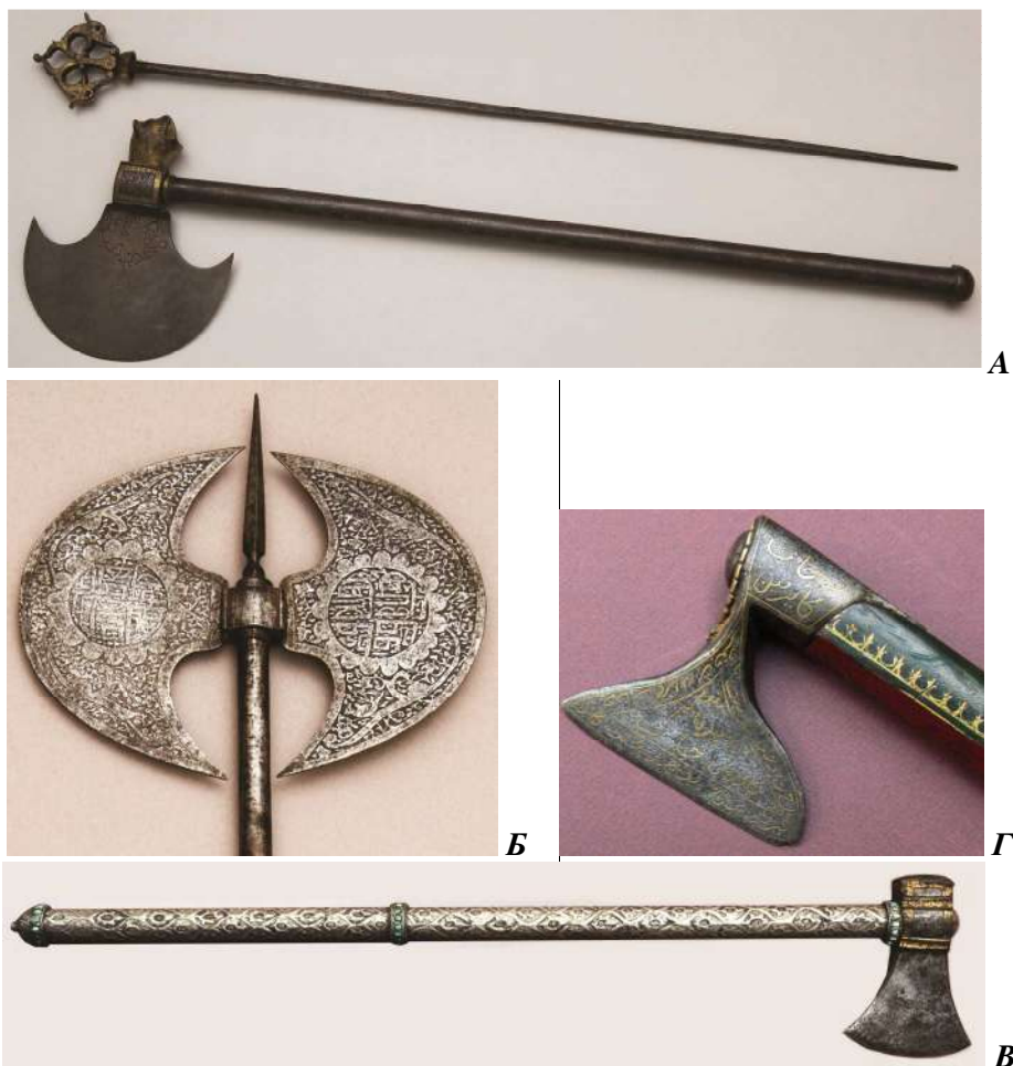
Фото 2. Основні різновиди перських бойових сокир у «Feldman Family Museum»: А — табер з булатною бойовою частиною та стилетом, що вкладається в пустотілий металевий держак. Персія, поч. XIX ст.; Б — табер з подвійною бойовою частиною. Персія, друга пол. XIX ст.; В — таберзін, бойова частина Персія, XVII ст., оправа — Хіва, XVIII ст.; Г — табер, Персія, друга пол. XVII ст.