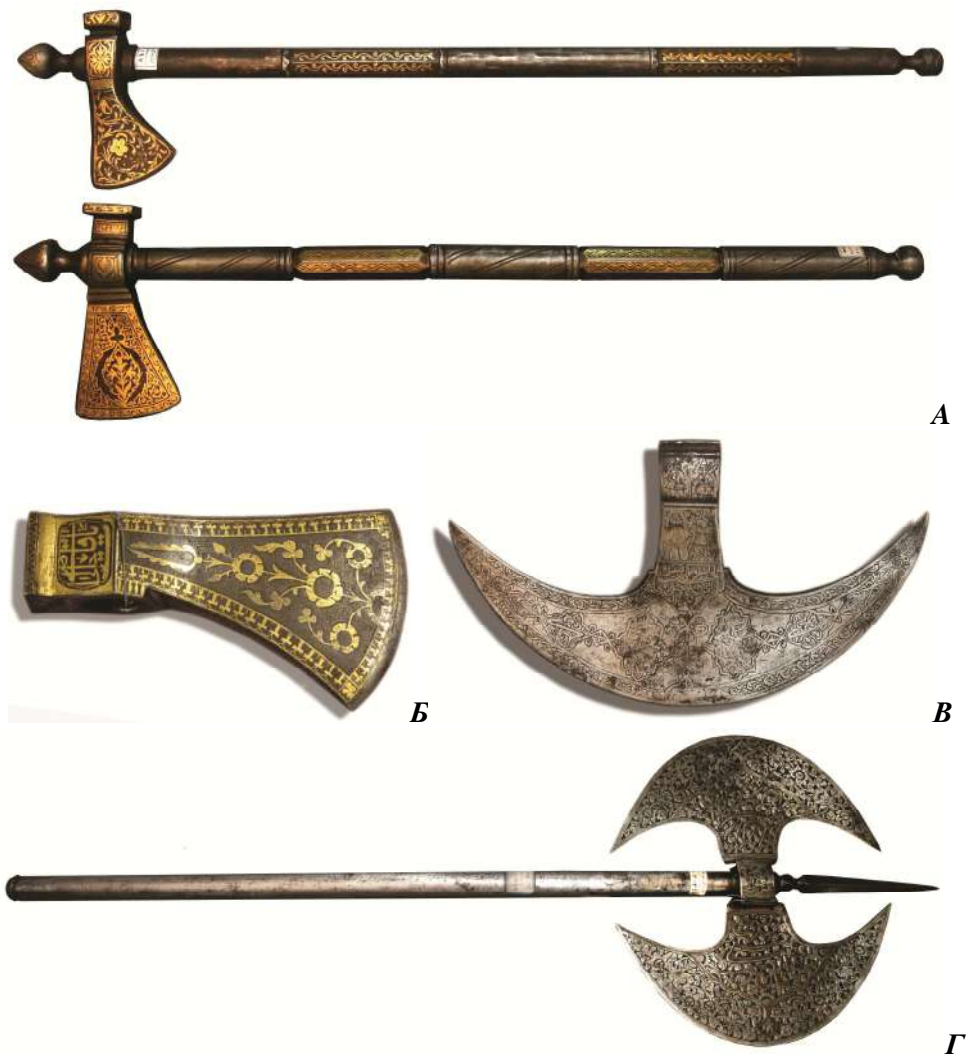
Фото 1. Основні різновиди перських бойових сокир у музеї Інституту культури Боньяд, Іран: А — два сталеві таберзіни (сідельні сокири) періоду Сефевідів, прикрашені золотою насічкою з рослинним орнаментом; Б — булатна бойова частина таберзіна періоду Афшаридів, декорована золотою насічкою з рослинним орнаментом; В — табер періоду Сефевідів, датований 1721 р.; Г — табер періоду Каджарів (1795–1925 рр.) з подвійною бойовою частиною, декорований різьбленим рослинним орнаментом та написами.

місцевого виробництва, віднайдені під час археологічних розкопок замку Д. Вишневецького на острові Байди, полі Берестецької битви тощо.