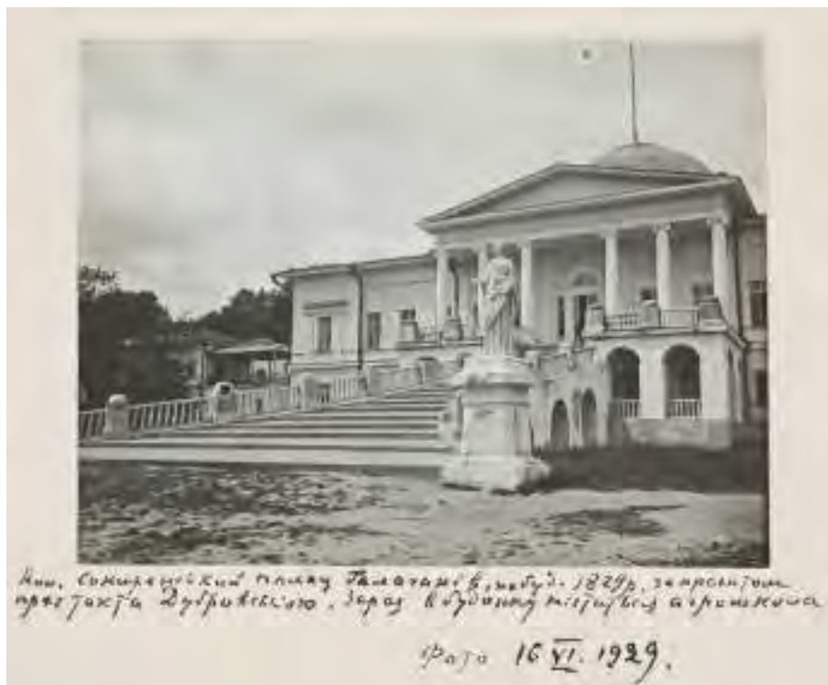
Фото 1. Палац Галаганів у Сокиринцях. Парковий фасад. 16.06.1929 р. 22

ків було досить прискіпливим. У повісті «Музикант» він описує свою зустріч із «Святою долиною», хоча в дещо іншій інтерпретації: «...действительно, это была икона Иржавецкой Божьей Матери, врезанная в этот дуб знаменитым прилуцким полковником год спустя после Полтавской битвы» 21 . Наявність міфологем, утворених у культурному просторі садиби в Сокиринцях, уже до середини ХІХ ст. засвідчують її значний духовно-інтелектуальний потенціал.