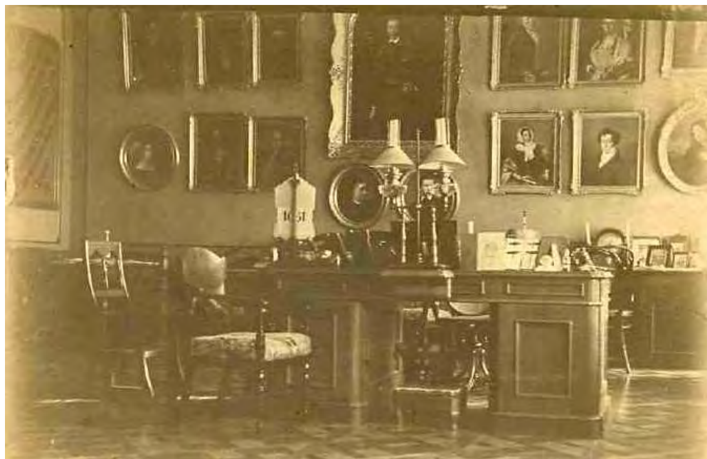
Фото 6. Кабінет палацу садиби в Сокиринцях. 1901 р. 70