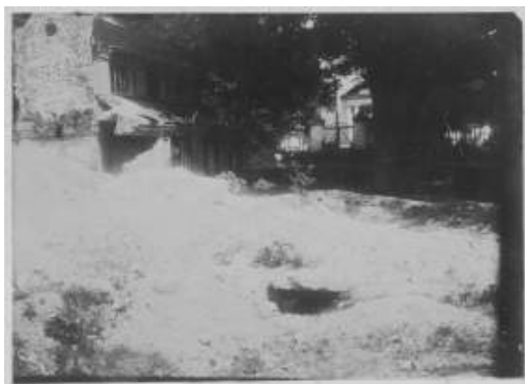
Фото 5. Склеп Галаганів під залишками церкви Петра і Павла. У глибині — ще ціла Варваринська церква. 16.06.1927 р. 56