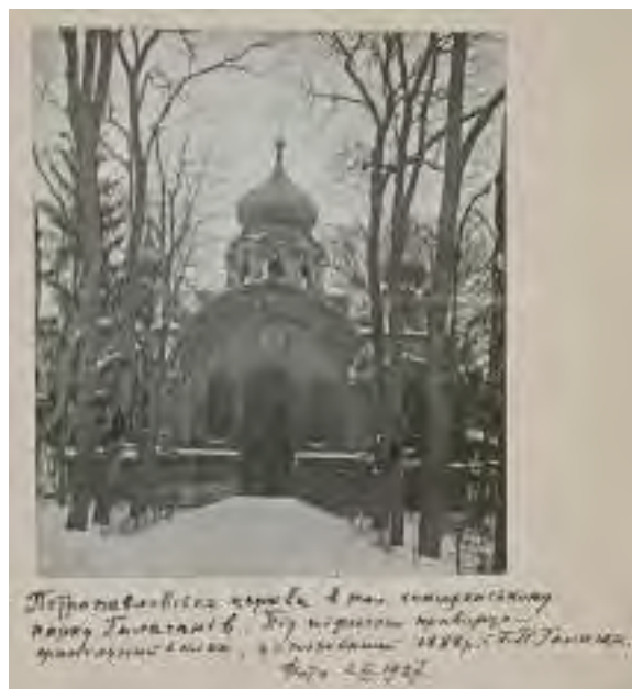
Фото 4. Церква Петра і Павла в Сокиринському парку. 1.02.1927 р. 55