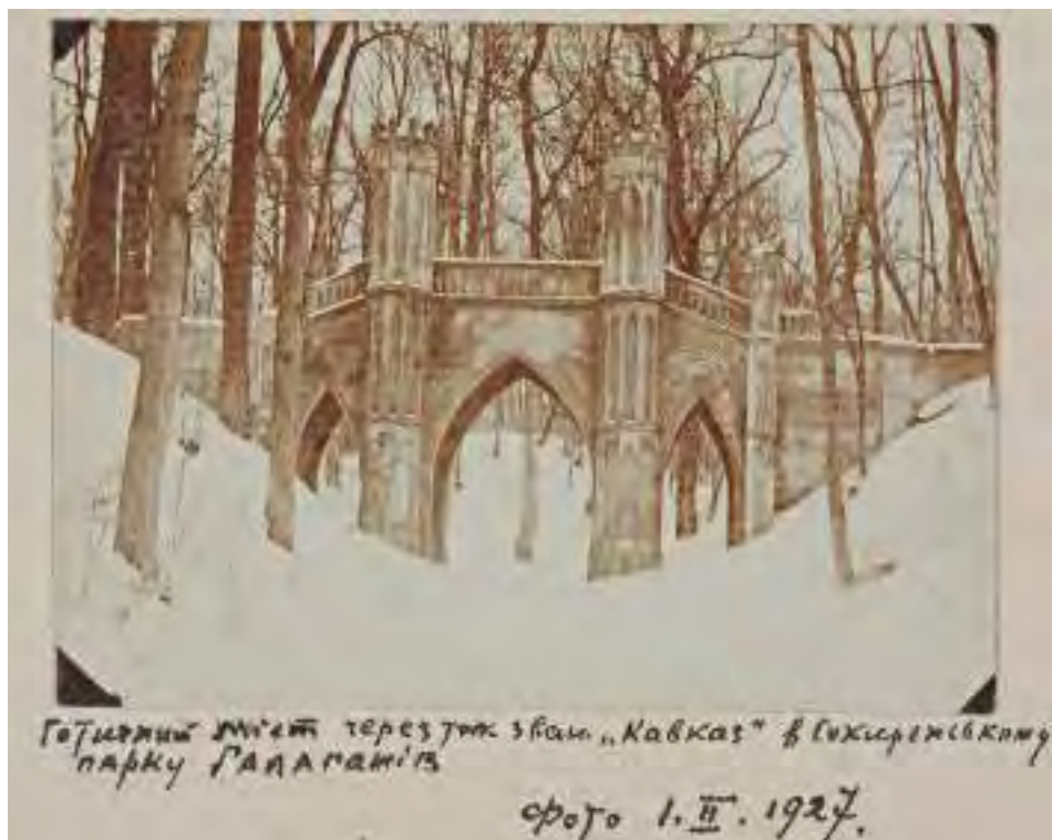
Фото 2. Готичний місток у Сокиринському парку. До сьогодні зберігся, але у стані руйнації. 1.02.1927 р. 46

спеціальну прибудову, де сушили овочі в промислових обсягах, унаслідок чого маєток мав значний прибуток 45 . Разом із цим руйнування не торкнулося споруд вхідної групи ансамблю садиби, що відмежовували її територію від навколишнього світу, та деяких господарчих приміщень, передусім теплиці, де ще до кінця 1920-х рр. зберігалися екзотичні рослини.