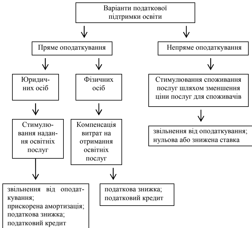
Рис. 1. Найбільш поширені варіанти податкової підтримки освіти

послуг некомерційного характеру органами державної влади у більшості країн звільнено від оподаткування [2]. Аналогічний підхід застосовано і в українському податковому законодавстві [4].