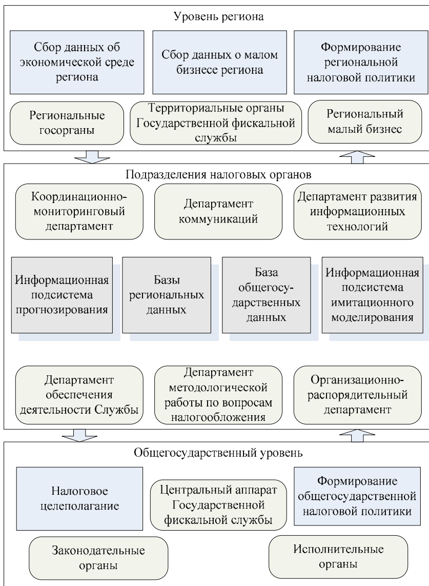
Рис. 1. Принципиальная структура информационного обеспечения администрирования налогообложения субъектов малого бизнеса региона