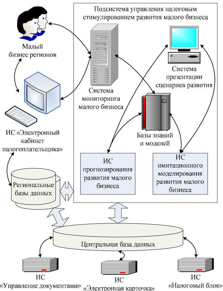
Рис. 3. Взаимодействие информационной системы управления налоговым стимулированием малого бизнеса с информационной средой ГФС

за пределы установленных интервалов создаются уведомления о необходимости проверки правильности реализации политики налогового стимулирования. В базе знаний и моделей содержатся правила обработки данных. База знаний представляет собой набор информации, охватывающей некоторую область знаний в структурированном виде, который пригоден для исполь- 216