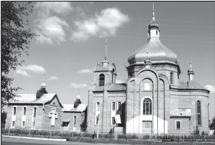
Церква 2000-ліття Різдва Христового

Франсуа Блондель-молодший, теоретик французької архітектури XVIII ст., сказав: "Задоволення, яке ми відчуваємо від прекрасного витвору мистецтва, залежить