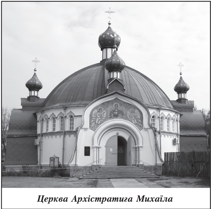
Церква Архістратиґа Михаїла

У новому житловому районі Масани з 1994 р. по 2000 р. збудовано храмовий комплекс, присвячений 2000-літтю Різдва Христового. До цього в Масанах стояла дерев'яна церква Різдва Богородиці XVIII ст., яка була розібрана в 80-ті роки ХХ ст. Повністю комплекс побудований в 2000 році. До нього входять: великий храм Різдва Христового, невелика тепла церква на честь ікони Божої Матері "Життедайне Джерело", відкрита і освячена напередодні Великодня 1996 р., недільна школа, а також джерело цілющої води.