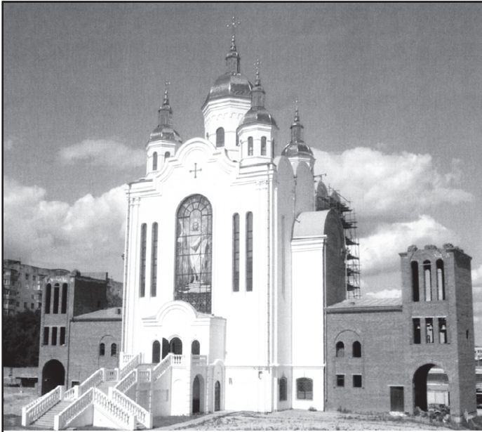
Церква Всіх Святих Чернігівських

па, відомого церковного діяча XVII ст. На вибраному ним шляху церковної діяльності святитель Феодосій у багатьох значних подіях того часу брав активну і жваву участь на рівні з такими своїми сучасниками, як св. Димитрій Ростовський, св. Митрофан Воронежський, Іов Новгородський, Лазар Баранович та Стефан Яворський.