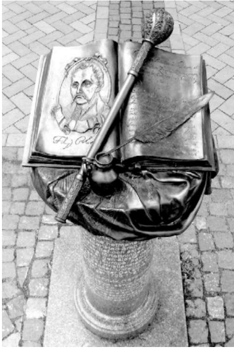
Пам'ятник Пилипу Орлику в Крістіанстаді, встановлений у 2011 році.

денції Карла XII і пов'язаних з ним осіб того періоду. В тому числі - й листування Пилипа Орлика.