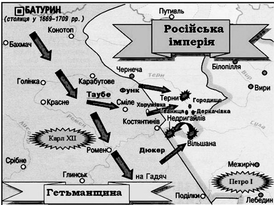
Карта бойових дій шведської армії у листопаді – грудні 1708 р.

Легенда про те, що під час російсько-шведської війни 1708 року недригайлівська фортеця встояла під натиском шведів, розповсюджена і донині. Розповідають, нібито російський самодержець Петро I, довідавшись про те, що містечко Дригайлів витримало штурм шведів, мовив: «Да какой же это Дригайлів, коли не дрогнул». Слово царя – закон, отож відтоді й став Дригайлів Недригайловом. Так розповідає легенда, а як же було насправді?