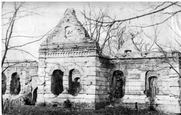
Фото 60-х років XX ст.

Про знесення прибудови часів К. Розумовського знаходимо свідчення у Василя Різниченка «Господа Генерального судді В. Кочубея в Батурині»: «...Первый этаж его подвергся перестройке: часть дома была разобрана, сделаны новые сволоки, крыша, дымовые трубы нового фасада, чудесные старинные кафельные печи были заменены новыми простыми» [12]. Знесення прибудови часів К. Розумовського та перепланування у другій половині XIX ст., про які пишуть