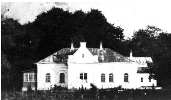
Фото кінця XIX ст. З фондової колекції НІКЗ «Гетьманська столиця».