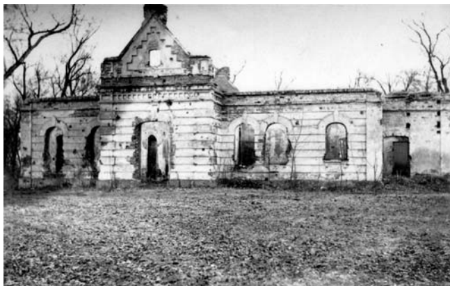
Фото 60-х років XX ст.