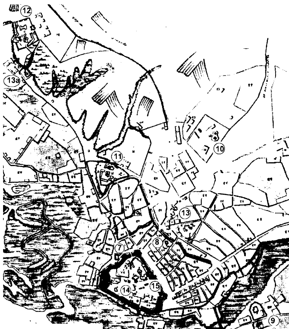
Рис. 3. План Чернігова кінця XVIII ст. з позначенням цегляних споруд (нумерація згідно зі згадками у тексті).

I. Давньоруські пам'ятки представлені: Спаським собором (№ 1), Борисоглібською церквою (№ 2), Успенською церквою (№ 11), Іллінською церквою (№ 12), П'ятницькою церквою (№ 13), храмом-усипальницею кінця XI ст. (№ 15).