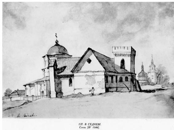
137. В СЕДНЕВІ Сена. LV. 1846.

Серед малярських творів Т. Г. Шевченка є й такі, дискусії з