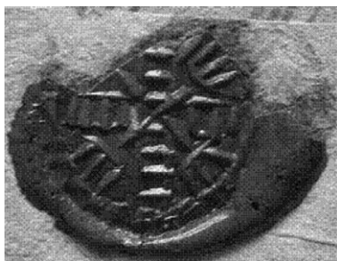
Печатка С. Левандовського

Асаул полковий чернѣговский Яков Крупянский //ЦДІАК, ф. 204, оп. 2, спр. 224, арк. 115.