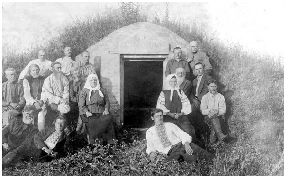
Члени Батуриною спілки імені П. І. Прокоповича біля відновленого склепу П. Прокоповича в с. Пальчики, фото 1925 р.

Поданная нами НКЗему докладная записка была, надо полагать, достаточно убе-