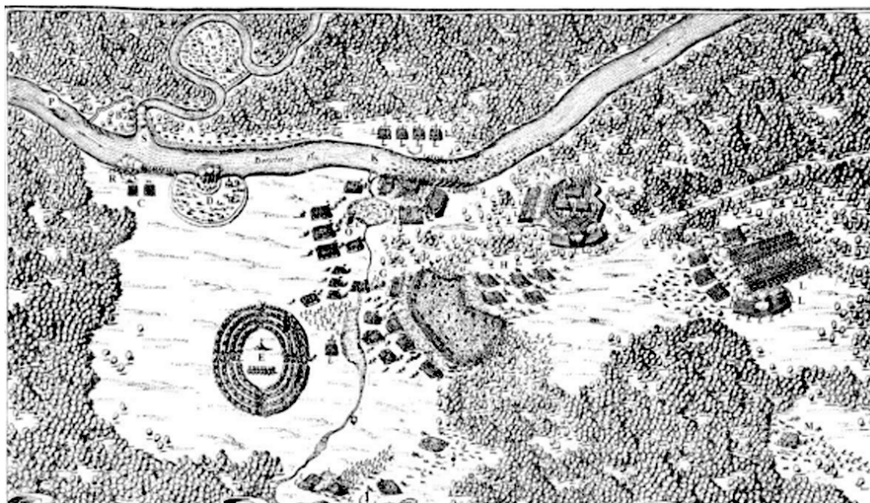
Лоевська битва (фрагмент гравюри) 57 .

Гірше склалася ситуація на лівому фланзі козацького війська. Козакам не вдалося тут закріпитися ба навіть перегрупуватися. Кіннота Гансевського відтіснила козаків на болото та чисте поле, де й знищила більшу частину повстанців. Значних втрат зазнала і армія ВКЛ, причому під самим Гансевським (майбутнім гетьманом ВКЛ) був убитий кінь. Кричевський у цей час перегруповував свої сили і очікував удару в литовський тил козаків Подобайла 56 .