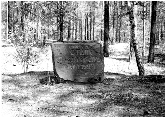
Пам'ятний знак на місці військового табору армії ВКЛ. Публікується уперше.

почестями за старим козацьким звичаєм на високій могилі (вочевидь, на якомусь кургані. – І. К.). Голландський живописець Абрахам Ван Вестерфельд зняв з обличчя Кричевського посмертну маску. 5-6 серпня, побоюючись нового удару, гетьман відвів армію за стіни Речицького замку, тоді ж був надісланий загін до Брагіна, щоб вибити звідти козаків. Сам Радзивіл ще кілька днів перебував у Лоеві 77 .