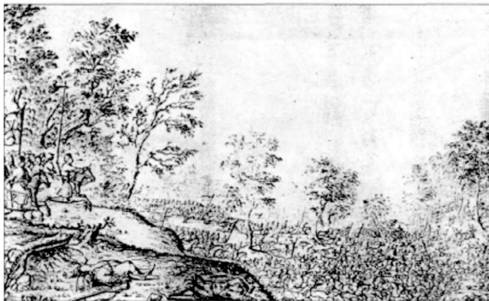
Атака кінноти Я. Радзивіла (гравюра 1649 р.) 43 .

Того ж таки дня армія Кричевського здійснила обхідний маневр, й глибоко вночі козаки підійшли до литовського табору з боку Брагіна. Дорогу козакам перегородила болотиста річка Вітач. Єдиним місцем, де її можна було форсувати, була гребля біля млина 42 .