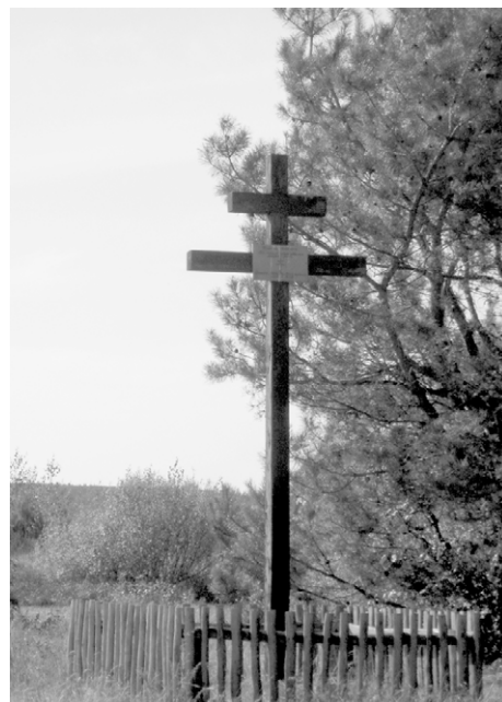
Пам'ятний хрест встановлений у 1997 р. на місці лоевської битви («Гладкому полі»). Публікується вперше.

По завершенні битви за наказом Радзивіла усіх загиблих схоронили у 16 великих могилах 76 на південній околиці Лоева. Лише у чотирьох перших було поховано 2700 чоловік. Кричевського похоронили з усіма