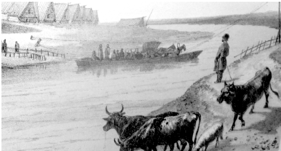
Переправа через річку (фрагмент малюнка XIX ст.), з фондів Ростовського музею-заповідника.

У цей час литовська армія просувалась територією Білорусі до лоевської переправи (як зазначають білоруські дослідники, десь до середини 1649 р. основні центри повстання на території білоруського Полісся були ліквідовані 19 ). Занепокоєний Хмельницький надіслав до Білорусі нові козацькі загони. Весною, взявши під свій контроль переправу через Сож, козаки здійснили наступ на Гомель. Біля міста зав'язалися бої із литовськими загонами Паца і Воловича, що тривали кілька місяців 20 .