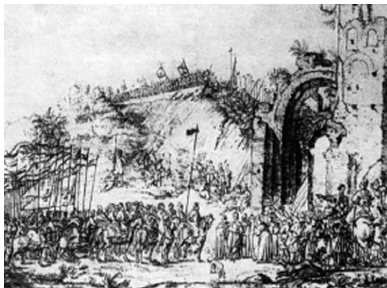
Вхід військ Радзивіла в Київ 41 .

Вже на початку липня 1651 р., розуміючи, що у нього замало сил, Радзивіл остаточно відмовляється від штурму Чернігова. Проблематичним був і подальший похід на Київ. Адже Чернігівська фортеця залишалася у тилу, до того ж, військові залоги треба було лишити і у захоплених