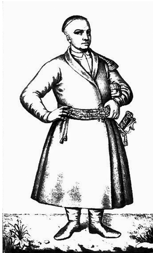
Рис. № 3. Сотник Лівобережного полку. З малюнку О. І. Рігельмана. Перша половина XVIII ст. Літографія. Папір. Друк. П., о. 25 x 17,5 см.