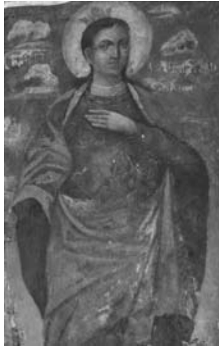
Лл. 4. Великомучениця Тетяна. Сучасний вигляд у стінописі Троїцького собору.