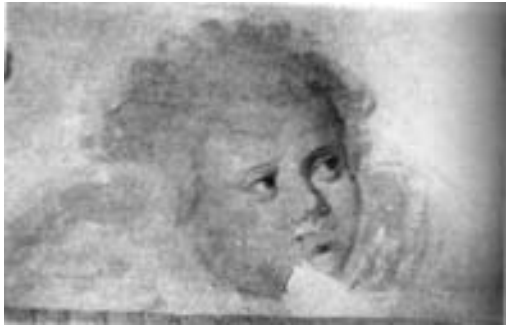
Лл. 2. Зображення херувима в нижній частині центрального підбанника Троїцького собору (А. Адруг. «Живопис Чернігова другої половини XVII – початку XVIII століття»).

надпис про ктиторів собору, збереглося зображення херувима над словами «начат здатися коштом» 7 .