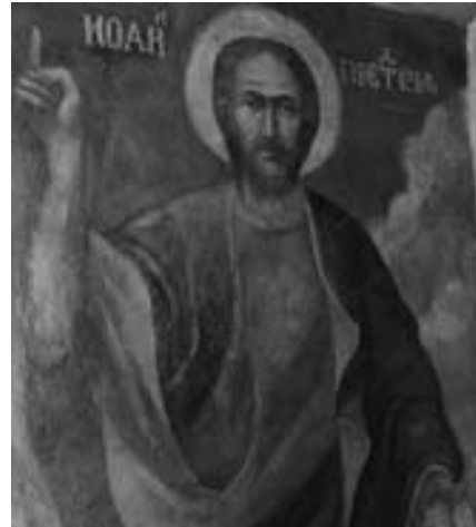
Лл. 3. Іоанн Предтеча. Сучасний вигляд у стінописі Троїцького собору.

Меценатська діяльність Івана Мазепи не обмежувалась лише зведенням Троїць-