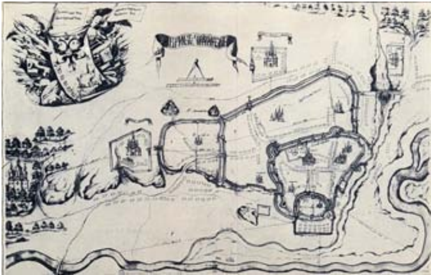
Рис. 1. План «Абрис Чернігівський». 1706 р.

муроване будівництво кафедрального монастиря у фортеці посилювало оборонні функції не лише чернечої обителі, але й фортеці в цілому, з огляду й на те, що в цей час велася російсько-шведська війна. Не випадково, що тоді були зведені кам'яні мури Києво-Печерської Лаври, Печерська фортеця у Києві, у 1706 р. Чернігів відвідав російський цар Петро I, і того ж року був виконаний мальований план міста Чернігова «Абрис Чернігівський» (Рис. 1). Це найстаріший план міста з тих що, зберігся до наших часів. На «Абрисі» Борисоглібський монастир та його споруди позначено досить схематично та спрощено. І це в значній мірі утруднює реконструкцію тогочасної топографії монастиря.