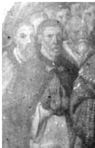
Фрагмент фотографії ікони з зображенням гетьмана І. Мазепи.