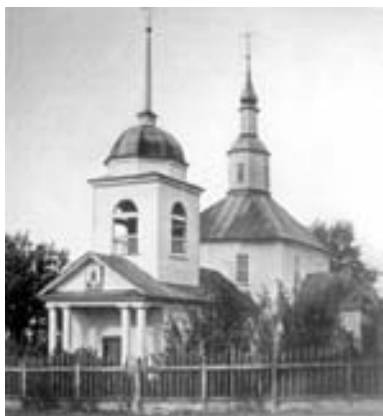
Церква св. Варвари з Новгород-Сіверського. Світлина 1916 р.

Ікона Покрови Богородиці (у кольорі) на момент її фотографування (1916 р.) С. Таранушенком була у Варваринській дерев'яній церкві Новгород-Сіверського (храм розташований на території колишньої фортеці) 2 . Розмір фотографії 10x8 см. З документальних джерел довідуємося, що С. Таранушенко протягом першої половини ХХ ст. відвідував Новгород-Сіверський кілька разів – у 1916, 1930 і 1932 рр. Під час своєї подорожі до міста у 1916 р. він досліджував і фотографував церкви – св. Миколая, св. Варвари та Покровський храм. Вочевидь, ікона була написана для іншої церкви і перенесена до храму св. Варвари, оскільки побудова останнього датується 1788 р. Церква не збереглася.