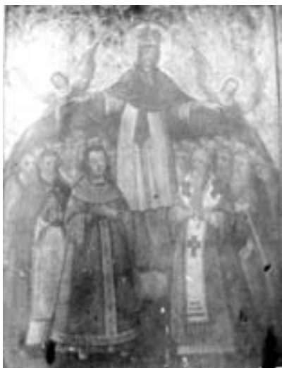
Фотографія ікони Покрови Богородиці. Світлина 1916 р.

Ікону можна віднести до унікальної пам'ятки українського живопису. Її композиційна схема для того часу була доволі традиційною. У центрі ікони ми бачимо образ Божої Матері у короні з Покровом, над яким зображені два янголи на фоні рослинного орнаменту. Під Покровом дві групи людей – світські особи (ліворуч) і духівництво (праворуч). Дійові особи на іконі зображені згідно з ієрархією. Кожне обличчя чітко промальовано.