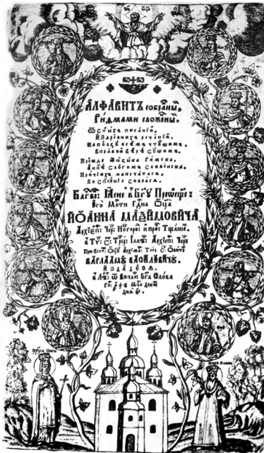
4. Борисоглібський собор. м. Чернігів. Алфавіт собраннй рифмами сложеннй. 1705 р.

12 січня 1684 р. гетьман І. Самойлович у листі до намісника Мгарського монастиря Макарія Русиновича повідомляв: «заліцил нам пан полковник Черніговский иншого майстра німецькое породы, на имя Ивана Баптисту, которого для поправки церкви пастырское до Чернігова з Литвы зятягнено. Тот, яко чинится быти в ділі майстерства своего досконалым, и волен будучи от работ инших, подымуется нам подлуг мысли нашей своею ростоительно наукою діло церковнее виставити» 68 . У літературі утвердилася думка, що німецький будівничий Іван Баптист – це Йоганн-Баптист Зауер, який працював у Вільно в другій половині XVII ст. В Україні він побудував також Спасо-Преображенський собор Мгарського монастиря (1684–1692 рр.).