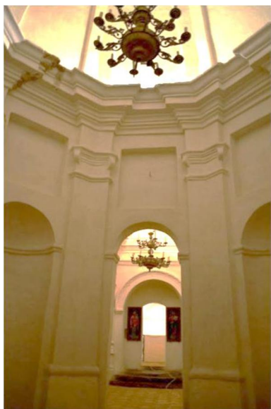
6. Інтер'єр притвору церкви прп. Феодосія Тотемського.

Для здійснення таких неординарних планів чернігівський полковник В. Дунін-Борковський запросив, про що вказувалося вище (певніше за все, на прохання Л. Барановича), знаного архітектора з Литви Й-Б. Зауера. Відомо, що чернігівський архієпископ мав тісні зв'язки з Вільно – столицею Великого князівства Литовського. Вільно відіграв велику роль у розвитку «руської» (україно-білоруської) культури наприкінці XVI – у 20–30-х рр. XVII ст. Свого часу Л. Баранович навчався у Вільно, певніше всього, у відомій Віленській єзуїтській академії 81 . Після реставрації кафедрального Борисоглібського собору Й-Б. Зауер міг брати участь у розбудові Троїцько-Іллінської обители, зокрема, у реконструкції стародавнього печерного комплексу Іллінського монастиря (притвор-ротонда Борисоглібського собору, побудована за часів Л. Барановича, подібна до притвору підземної церкви Похвали Богородиці) 82 та спорудженні Троїцького собору. Наприкінці 70-х рр. XVII ст. частину земляних печер, розташованих біля Іллінської церкви, кардинально перебудували: на їх місці спорудили в бароковому стилі три кам'яні барокові підземні церкви, одна з яких – церква Похвали Пресвятої Богородиці 83 – найбільша з печерних церков Лівобережної України. Аналіз письмових джерел та розвиненої архітектури підземних церков Іллінського монастиря: церкви прп. Антоія Печерського, церкви Похвали Пресвятої Богородиці та св. Миколи Святоші засвідчив, що вони були побудовані наприкінці XVII ст. у стилі зрілого бароко, з харак-