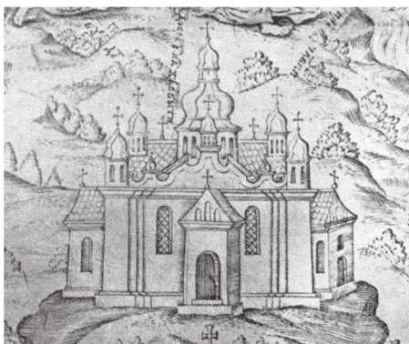
2. Спасо-Преображенський собор. м. Новгород-Сіверський. Службеник. 1665 р.