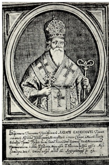
1. Портрет Лазаря Барановича. Гравер О. Тарасевич. 1693 р. Мідьорит.

6 грудня 1657 р. київським митрополитом був обраний луцький єпископ Діонісій Балабан, ставленик гетьмана І. Виговського. У 1658 р. митрополит переїхав із Києва до гетьманської столиці Чигирин, резиденції І. Виговського, якого він підтримував. Від'їжджаючи до Правобережної України, Д. Балабан надав Л. Барановичу наступні протопопії: чернігівську, менську, борзенську, новгородську, стародубську, глухівську, конотопську. 20 листопада 1658 р. митрополит писав: «Повідомляємо всім загалом і кожному окремо, що, беручи до уваги бідність Чернігівської єпископської кафедри, а також важливі заслуги отця Лазаря Барановича, ми наказуємо, щоб протопопії, які здавна належали до нашої митрополичої кафедри – чернігівська, менська, борзенська, глухівська, конотопська, новгородська та стародубівська, – з цього часу підкорялися отцю Чернігівському як своєму пастирю і доходи, куничні чи столові, відповідно до стародавнього звичаю віддавали, а дяки всіх названих протопопій рукоположення і благословення на ієрейство брали через його милість єпископа Чернігівського, і в усьому йому були слухняні» 19 . Таким чином, фактично Л. Баранович як чернігівський єпископ став архієреєм