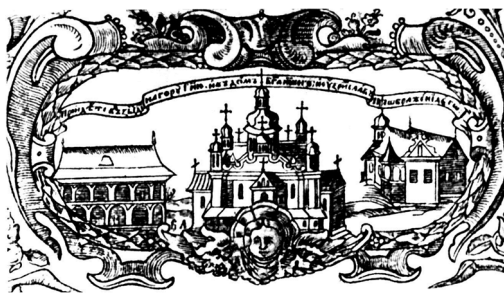
3. Спасо-Преображенський собор. м. Новгород-Сіверський. Анфологон. 1678 р.

лювалася думка, що Л. Баранович міг завершити реставрацію собору, яку розпочали ще єзуїти. Вони перетворили православну церкву в костел і прагнули її перебудувати в дусі європейських двоверхових базилік. Відтак Спасо-Преображенський собор міг послужити прототипом для спорудження подібних храмів, у тому числі Троїцького собору в Чернігові 30 . Можливо, Л. Баранович дійсно продовжив реставрацію, розпочату єзуїтами, які нада-