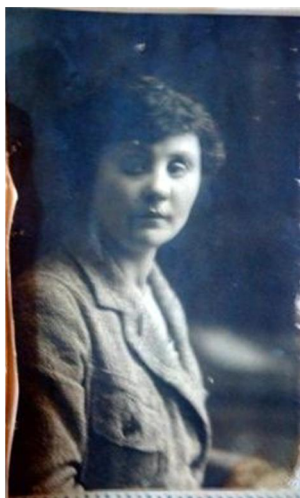
Фото 1 22