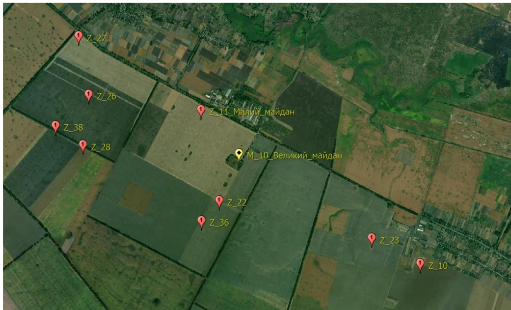
Рис. 4. Розташування споруд в південній околиці с. Лецьки та північно-західній околиці с. Пологи-Чобітьки.

Розташовувався за 900 м на південний захід від колишньої тракторної бригади с. Лецьки та за 2180 м на схід від Z 23 (Рис. 4). Споруда мала округлу форму, вхід орієнтовано на північний захід. Виявлено ознаки лише одного вуса (ймовірно, майдан мав пару С-подібних вусів). Діаметр плями насипу – 33 м, котловану – 13 м. На картах об'єкт не позначено.