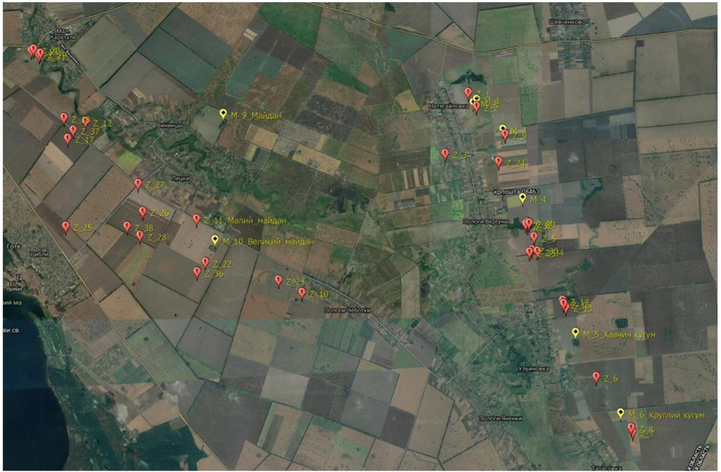
Рис. 5. Загальна карта розташування майданів у межах мікрорегіону.

У межах обох скупчень виявлено щонайменше сім майданних груп, до складу яких входять кілька майданів (вцілілих або зруйнованих), та у деяких випадках розташовані поруч знівельовані кургани, що мали невеликі розміри. Відсутність останніх на картах ХІХ ст. може вказувати на факт їх руйнації до моменту топозйомки, що також переконує в можливості використання землі з насипів споруд під час селітроваріння поруч із майданами більших розмірів.