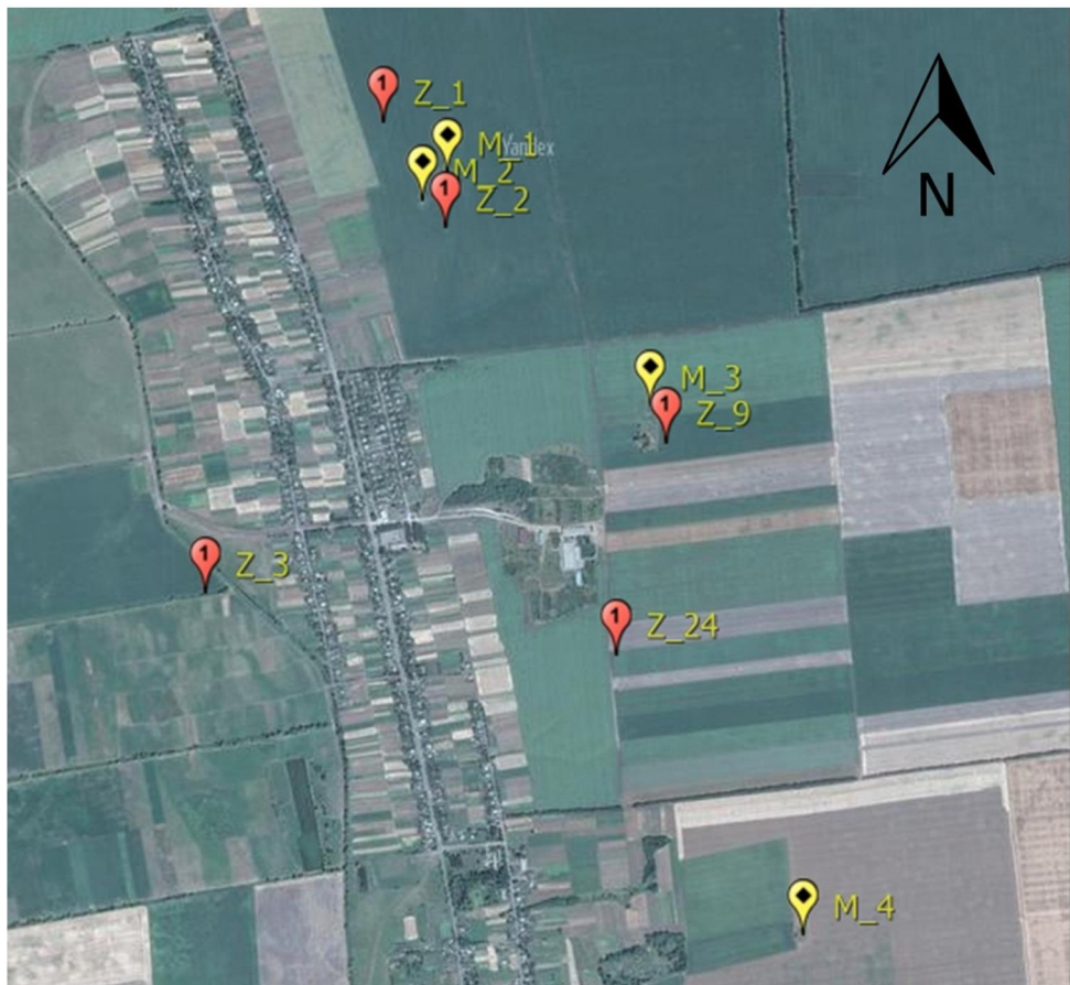
Рис. 1. Майдани в східній околиці с. Натягайлівка.