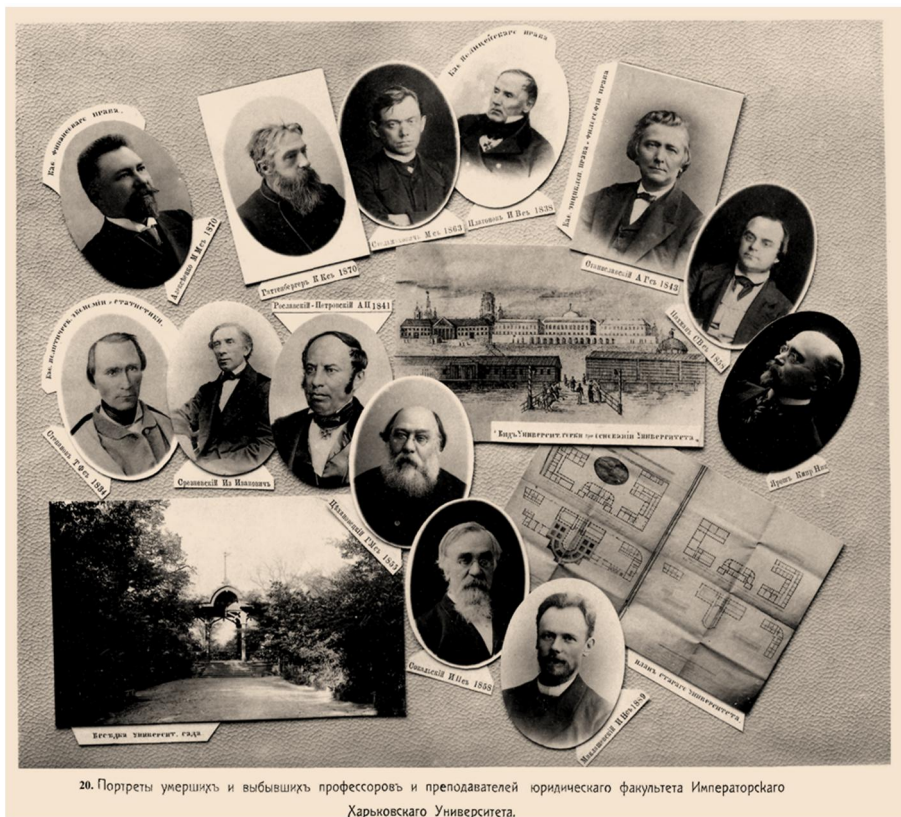
20. Портрети умерших и выбывших профессоров и преподавателей юридического факультета Императорского Харьковского Университета.