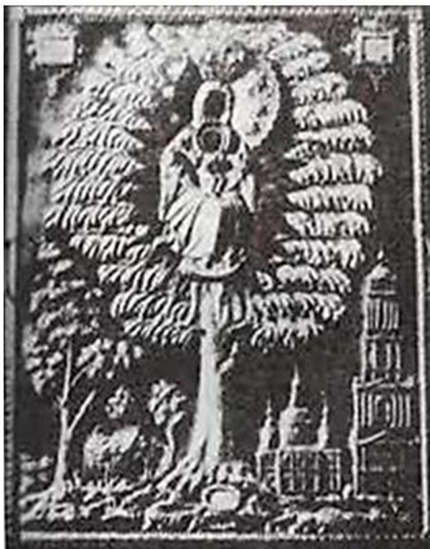
Іл. 6. Ікона «Слецька Богородиця» з Успенського собору м. Харкова. Др. пол. XVII ст.

собору м. Харкова. Водночас зображення на цих іконах подібне до гравюри Богородиці на дереві з книги Іоанікія Галятовського «Скарбница потребная», яка була видана у 1676 р. (Іл. 7). На ній зображена Марія в мандорлі у променях сяйва на дереві, внизу ліворуч – Успенський собор Єлецького монастиря, праворуч – частина стіни та вежа Чернігівської фортеці. Богородиця, що сидить, тримає на колінах Ісуса, правою рукою торкається його правої ніжки. Христос зображений фронтально з розведеними в сторони руками: правою рукою благословляє, в лівій тримає сувій. Навколо голів Богородиці й Спасителя – німби. Гравюра має підпис: «Образъ Пресвятія Богородице Черниговской». Зображення на гравюрі відповідає опису ікони Богородиці на ялині з книги І. Галятовського «Скарбница потребная»: «...где намалювано дерево еловое альбо елину зъ галузьями зелеными, межи тыми галузьями зелеными высоко сидячая ест намалювана родителка Божая, на своихъ коленах дитячко, Христа сидячого, под пахи левою рукою держачая, а правою рукою Христа за ноги держить, а Христос въ левой руке держить хартію звитую» 8 . Можна припустити, що так могла виглядати ікона «Богородиця Єлецька», яка з'явилася у 1676 р. в монастирі.