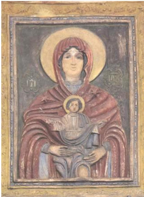
Іл. 1. Керамічна ікона «Єлецька Богородиця». Поч. XVIII ст.