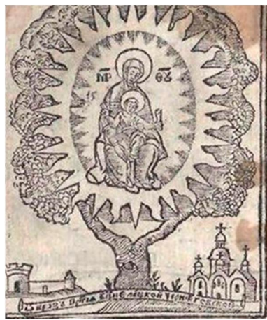
Іл. 7. Ікона «Слецька Богородиця». Гравюра з книги «Скарбница потребная». 1676 р.

Гравюру, на якій зображена «Слецька Богородиця», вирізняє поетичний образ барокового стилю: міцний стовбур дерева увінчує величезна округла крона, яка не дуже схожа на ялину. Вона обрамлює овал мандорли з широкими променями, всередині нього для посилення сяйва знов таки зображені промені, що оточують фігуру Богородиці, яка схилила голову й дивиться на Ісуса Христа. Той досить невимушено сидить у неї на колінах із розведеними в сторони руками. Гравер уже передав об'ємність та рельєфність бганоку мафорія Богородиці, який природно спадає дотолу. До речі, такою ж округлою кроною дерева та мандорлою з променями вирізняється й ікона «Слецька Богородиця» з харківського Успенського собору. Як бачимо, на гравюрі образ «Слецька Богородиця» виритований у бароковому стилі, позначений елементами європейського впливу, характерному для українського мистецтва др. пол. XVII ст. Це суперечить свідченням Іоанікія Галятовського, що ікона «Слецька Богородиця» була привезена з Московії, з м. Володимира і передана в