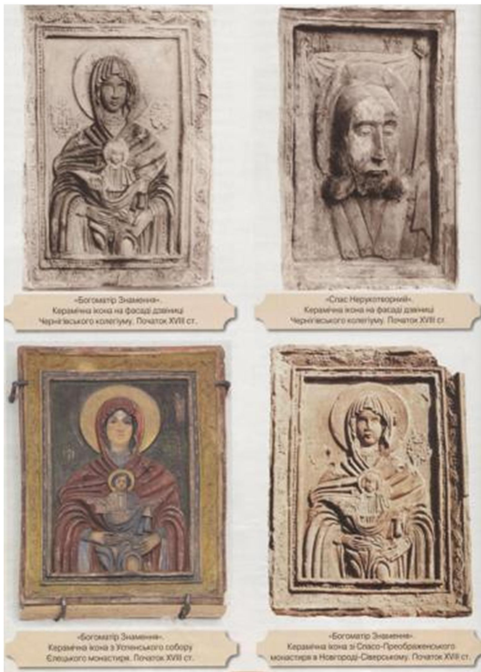
Іл. 4. Керамічні ікони Чернігівщини. Поч. XVIII ст.

Оздоблення фасадів керамічними рельєфами було досить поширене в Україні. Так, дзвіницю будинку Чернігівського колегіуму, окрім чотирьох керамічних ікон, прикрашала керамічна закладна дошка із зображенням герба гетьмана І. Мазепи. На розповсюдження керамічного рельєфного виробництва значною мірою вплинуло західноєвропейське мистецтво, зокрема традиції оздоблення фасадів споруд скульптурами та барельєфами. Водночас ця традиція існувала на теренах України-Русі ще з давньоруських часів. Відомо, що Успенський собор Києво-Печерської лаври прикрашав триптих із зображенням Богородиці-Оранти та прп. Антонія й прп. Феодосія (XV ст.).