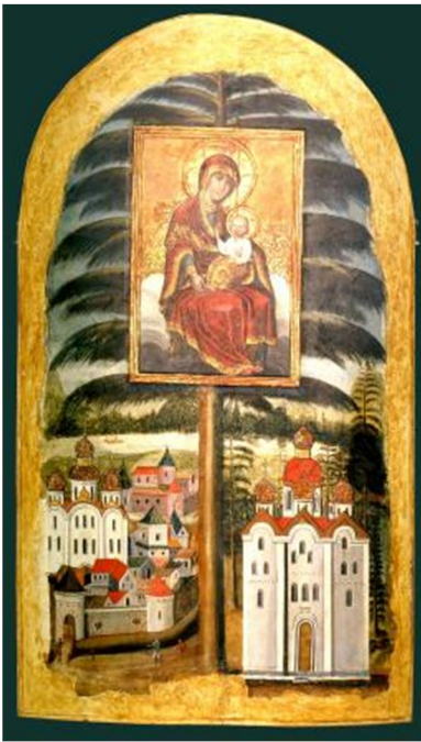
Лл. 3. Ікона «Єлецька Богородиця». 90-ті рр. XVII ст.

Керамічна ікона свого часу прикрашала західний фасад Успенського собору й була в лонеті центральної закомари в обрамленні барокового картуша. На іконі «Єлецька Богородиця» вона не зафіксована. Датування ікони «Єлецька Богородиця» 90-ми рр. XVII ст. А. Адрюг аргументував тим, що на ній ще відсутній приділ Св. Якова, в якому було поховано чернігівського полковника Якова Лизогуба (помер у 1698 р.) 1 . Приділ Св. Якова було прибудовано з південної сторони собору і освячено у 1701 р. 2 Можна припустити, що ікона з'явилася на фасаді собору пізніше, на початку XVIII ст. Подібні дві ікони оздоблюють також дзвіницю будинку Чернігівського колегіуму, яка була побудована, як свідчить її закладна дошка з гербом гетьмана І. Мазепи, у 1700–1702 рр. Одна ікона розміщена всередині верхнього ярусу дзвіниці, інша – ззовні, на південно-східній стороні, між розетками, які утворюють орнаментальний фриз під карнизом даху. На недалекій відстані від неї є також керамічна ікона «Спас Нерукотворний». Ще одна керамічна ікона із зображенням Богородиці прикрашала центральну браму новгород-сіверського Спасо-Преображенського монастиря. І. Ігнатенко вважає, що керамічні ікони були виготовлені з однієї форми, тобто