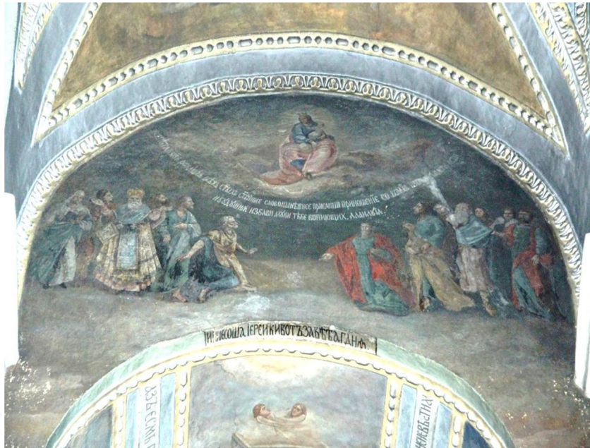
Іл. 2. Західна стіна північного трансепту, композиція «О, Всехвальна Мати». Сучасний вигляд.

На західній стіні північного трансепту, над аркою хорів собору художниками XIX ст. створено цікаву багатопігурну композицію «О, Всехвальна Мати» (Іл. 2).