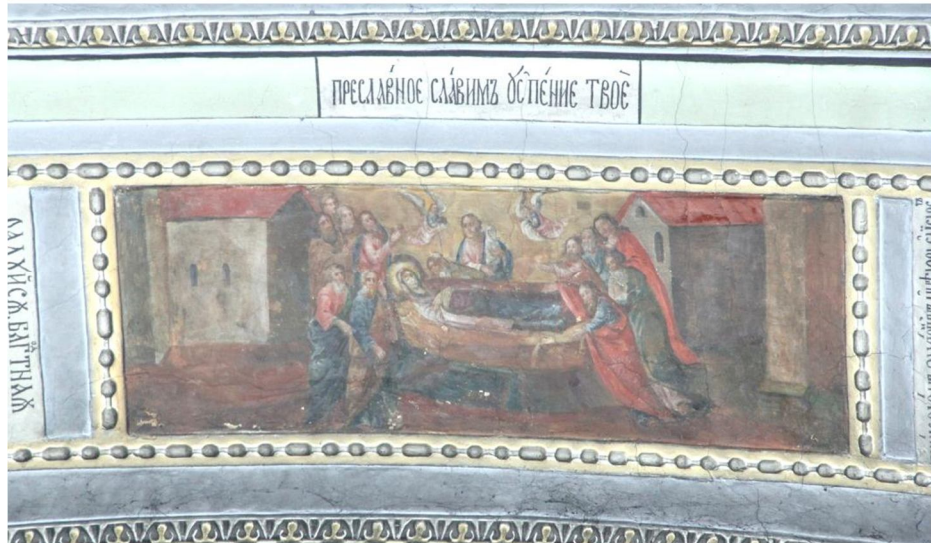
Іл. 4. Центральна композиція північної арки північного трансепту, сюжет «Успіння Богоматері». Сучасний вигляд.

Стилістично надзвичайно відрізняється від описаних композицій зображення у центральній прямокутній рамі північної арки трансепту. Змальований тут сюжет «Успіння Богоматері» має на відміну від решти композицій на арках горизонтальну орієнтацію, на ньому превалує тепла кольорова гама (Іл. 4). Для зображення характерне тяжіння до площинності та силуетності, зведення фігур до свого роду орнаментальних знаків без промальовки деталей та індивідуальних рис, а іконографії сюжету – до найпростішої схеми, де сприймається сама її суть.