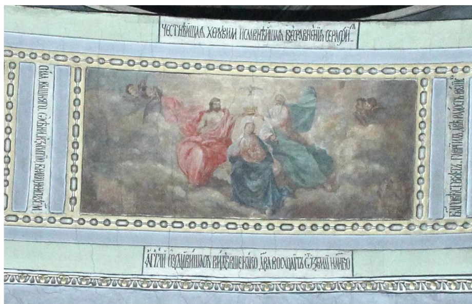
Ил. 5. Центральна композиція південної арки, композиція «Коронування Богородиці». Сучасний стан.

Внизу під композицією бачимо напис: «Ангели, Успіння Пречистої бачучи, здивувалися, як то Діва сходить від землі на небо». Це рядок із задостойника свята Успіння Пресвятої Богородиці, підпис до сюжету, розміщеного по центру склепіння трансепту.